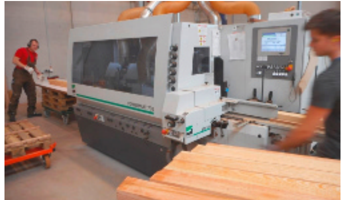
Auf einem in Tauberbischofsheim produzierten Weinig Kehlautomaten dieses Typs werden bei der Firma Runge die Leisten für die Bänke hergestellt.

Anträge auf Patenschaften für Bänke, ebenso wie für Bäume und Spielgeräte sind schon eingegangen. Für Interessenten heißt es also, sich zu beeilen.