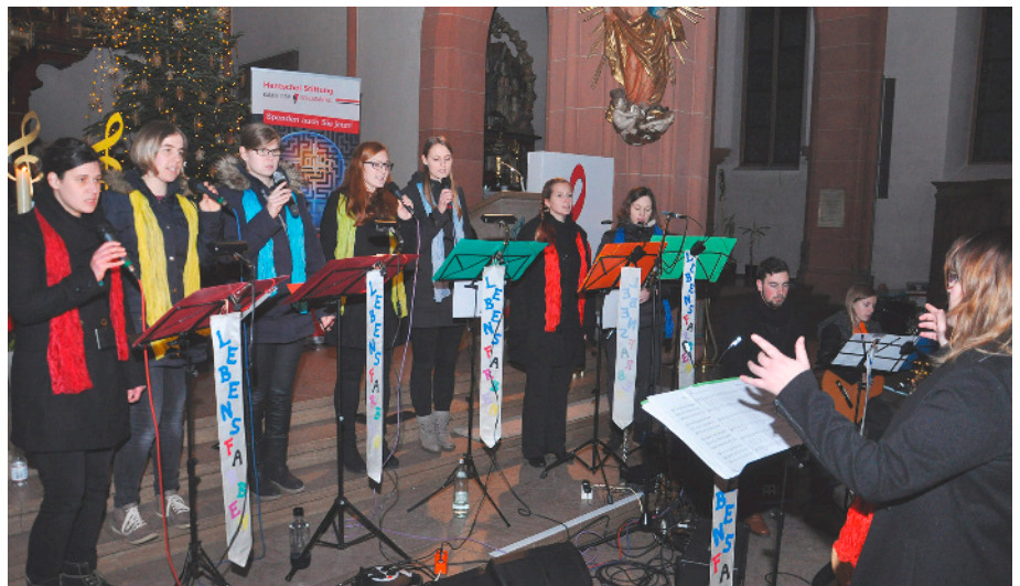
Foto und Bericht: Dr. Ulrich Feuerstein, verändert Madeleine Wagner

Die beiden Meditationskonzerte machten das einmal mehr deutlich: Die „Lebensfarben“ hatten auf Eintrittsgelder verzichtet und baten stattdessen um Spenden. Die kamen der Stiftung „Kampf dem Schlaganfall“ zugute (Bericht folgt). Günter Hentschel freute sich, dass die Musikerinnen und Musiker sich in den Dienst der guten Sache stellen. Seine Stiftung unterstützt medizinische Forschungen an der Universität Würzburg, mit denen Therapieformen bei Schlaganfall gefunden werden sollen.