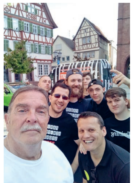
Ein „Selfie“ beim Rosé-Wein-Festival auf dem Bischemer Marktplatz

Im kommenden Jahr feiern die Handballer in Vitry ihr 60-jähriges Vereinsjubiläum, wozu schon jetzt eine Einladung ausgesprochen wurde. Man möchte 2024 etwas „größer denken“, und neben der zweiten Männermannschaft auch die erste Mannschaft und die weibliche A-Jugend einladen, so dass ein ganzer Bus die Reise antreten könnte. Der Termin ist noch nicht exakt bestimmt, wird aber wohl Ende Mai, Anfang Juni sein. Unser Städtepartnerschaftskomitee wird dabei wie immer bei Absprache und Organisation behilflich sein. Psk