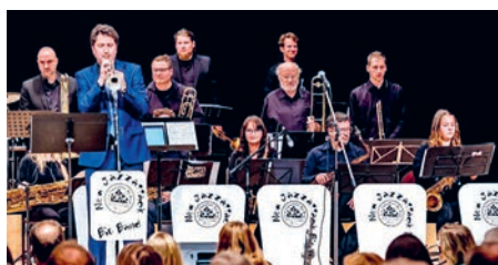
New Jazzattack Big Band