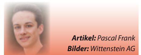
Artikel: Pascal Frank